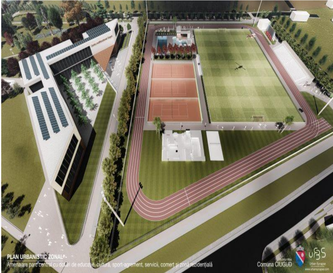
School and sports fields