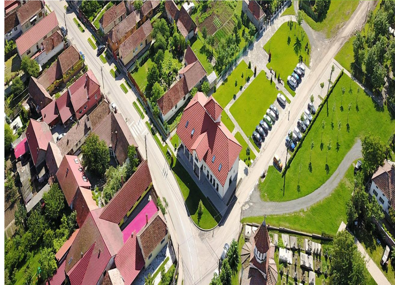
The town hall